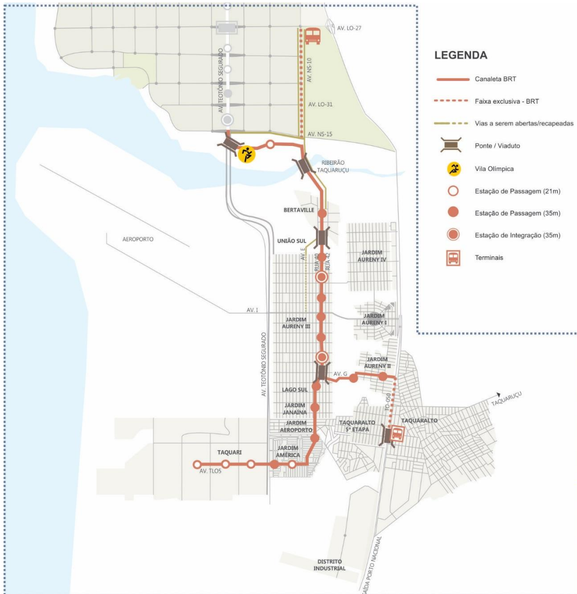
Figura 2 - Corredor BRT Palmas Sul