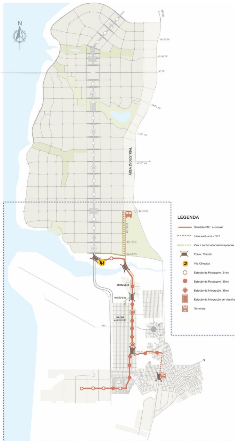
Figura 1 - Corredor BRT - Situação Corredor BRT Palmas Sul